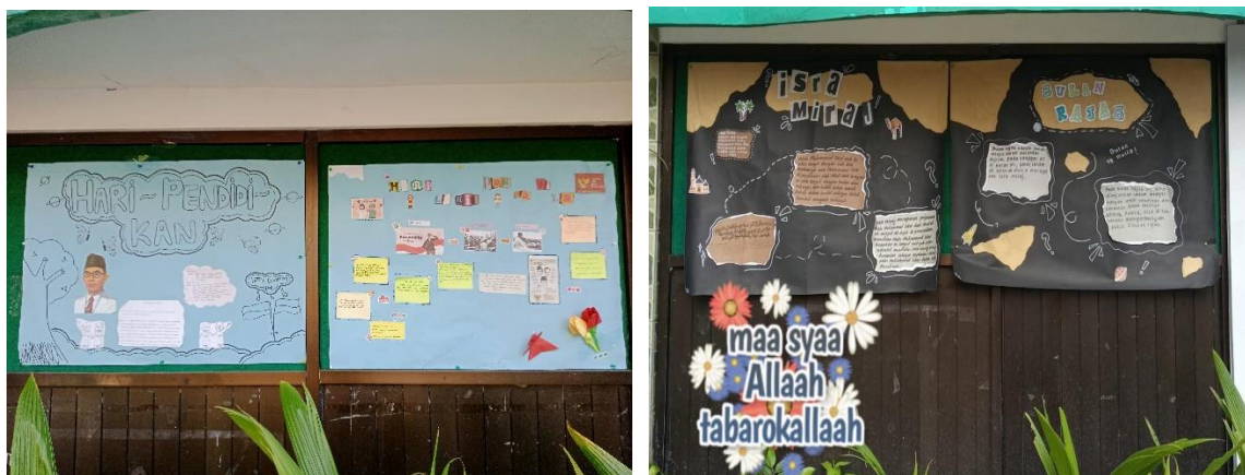
Keterangan: Hasil Kreativitas Siswa Berupa Papan Mading