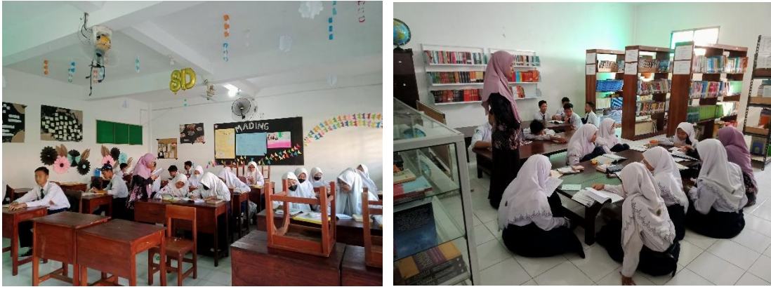
Keterangan: Pelaksanaan Budaya Literasi