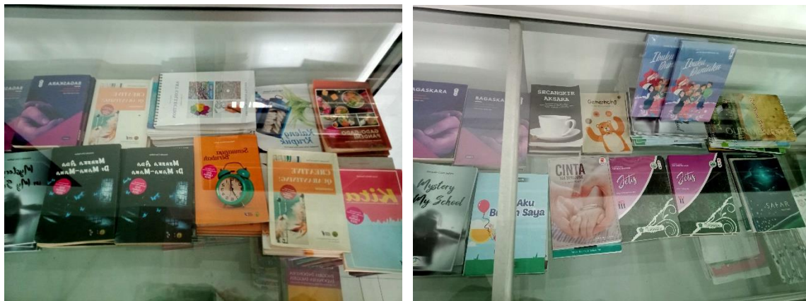
Keterangan: Hasil Kreativitas Siswa Berupa Buku